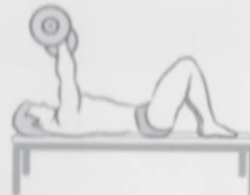
Supine flexion and extension