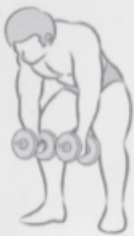
Prone side lift