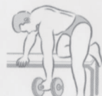
Prone side lift