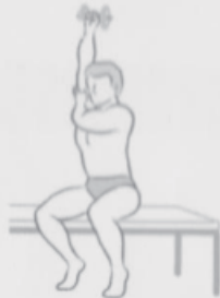
One handed dumbbell arm extension