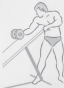
Inclined plate bending