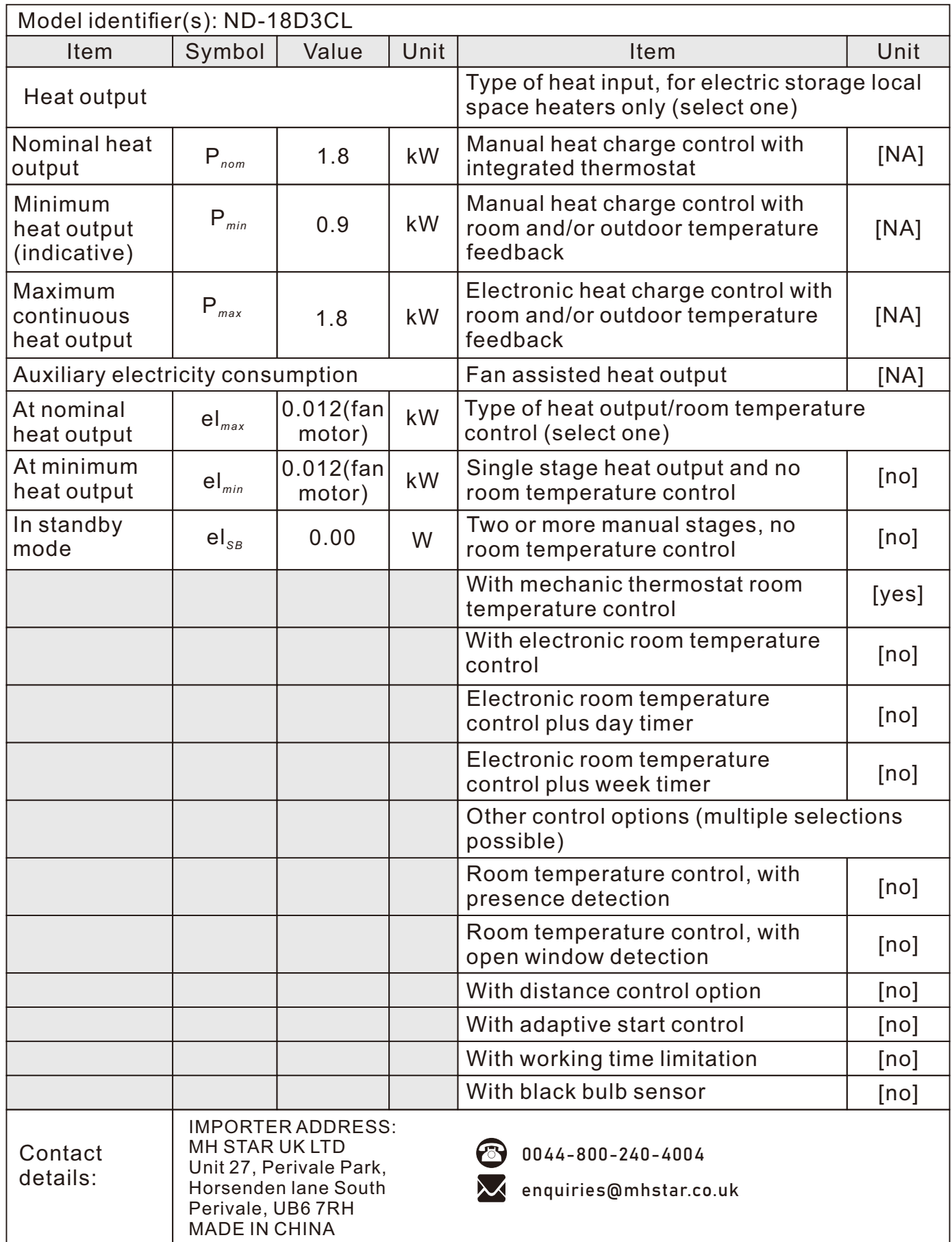
Table for information requirements for electric local space heaters